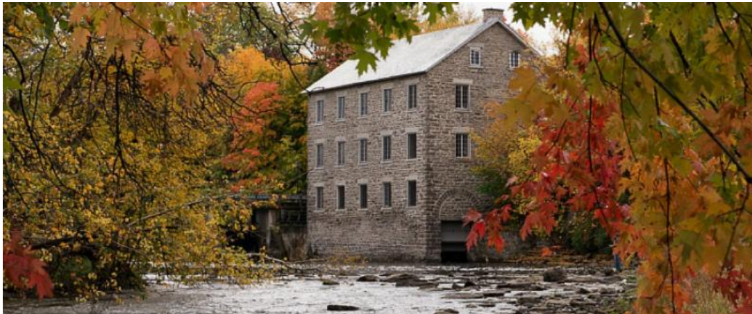
Harvest at Watson's Mill

We hope all enjoyed a great long weekend in Canada's Capital region - so resplendent in colour and rich in heritage spaces, places and experiences.